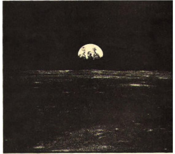
Earthrise, seen from Apollo 11, July 1969

உலக தினம் பற்றின கருத்து உருவாகுவதை முதன் முதலில் உணர்ந்தவர், இருபதாம் நூற்றாண்டு அறிவியலில் முக்கிய சிந்தனையாளரும், தனிமனிதனாக எழுந்து மற்றும் இரண்டு சந்ததிகளுக்கு முன்பாக சிந்திக்கும் விசேஷித்த திறமைக்குரியவரைச் சேரும். இவர், வாழ்வியல், இயற்பியல், வேதியல் மற்றும் புவியியலின் கலப்பினை ஆராய்வதில், பூமியை விண்வெளியிலிருந்து பார்ப்பது போன்று கற்பனை செய்யும்மாறு தம்முடைய வாசகர்களை அழைத்தார். இவர் தம்முடைய கருத்தை "பூமியின் முகம், விண்வெளியிலிருந்து பார்க்கும் பொழுது, ஆகாயத்தில் உள்ள அனைத்து சிருஷ்டிகளிலுமிருந்து வேறுபட்டதாக .... தனித்தன்மையுடன் காட்சியளிக்கிறது" என்ற வார்த்தைகளின் மூலம் துவங்குகிறார் (விலாடிமிர் ஐ . வெர்நாடஸ்கி, தி பையோஸ்பியர் 1926). நம்முடைய பூமியை ஒரு விசேஷித்த அல்லது தூதர்களுக்கு ஒத்த நிலையிலிருந்து பார்க்கும்படியான இவருடைய அழைப்பு, 1969- ஆம் ஆண்டு, ஜூலை மாதம், சந்திரனை சுற்றி வந்து இன்று நாம் காண்கிறதான