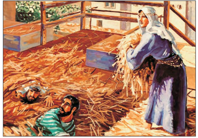
Rhab, hiding the spies

வாழ்க்கையின் பயன்படுத்துவதை நிறுத்தும்போது, தேவனுடனான நமது உறவையும் அந்த உறவின் ஆசீர்வாதங்களையும் பணயம் வைக்கிறோம். தேவன் தம்முடைய அறிவை நமக்கு வெளிப்படுத்துகிறார், எனவே அதை நம் வாழ்வில் பயன்படுத்துவதன் மூலம் நாம் ஆசீர்வதிக் கப்படுவோம். " அவர் நீதிமான் களுக்கென்று மெய்ஞ்ஞானத்தை வைத்துவைத்திருக்கிறார், உத்தமமாய் நடக்கிறவர்களுக்கு அவர் கேடகமாயிருக்கிறார். அவர் நியாயத்தின் நெறிகளைத் தற்காத்து தம்முடைய பரிசுத்தவான்களின் பாதையைக் காப்பாற்றுகிறார்." (நீதிமொழிகள் 2:7-8)