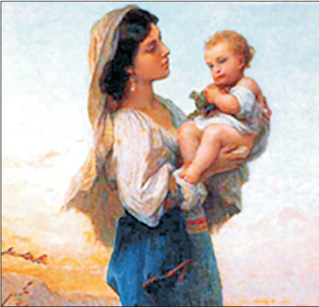
Mary with her miracle baby

தேவனுடைய தயவு, மரியாளுக்கு உறுதியளித்த பிறகு, காபிரியேல் தான் அனுப்பப்பட்ட தீர்க்கதரிசனத்தை வெளிப்படுத்தினார்: மேசியாவின் வருகையைக் குறித்த முக்கியமான அறிவிப்பு. தாவீதின் வம்சத்தில் வரும் முடிவில்லா இராஜ்யத்தின் இராஜாவின் தாயாக அவள் இருக்கவேண்டும். அவள் மேசியாவின் தாயாக இருக்க வேண்டும், இது நீண்ட காலமாக யூதப் பெண்கள் எதிர்பார்த்து ஜெபித்த ஒரு மரியாதைக்குரிய காரியமாக இருந்தது.