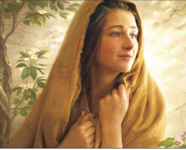
Mary, Mother of Jesus

"எல்லாவற்றையும்" விட்டாள். "என்னைப் பின்பற்றுங்கள்" என்று இயேசு கடற்கரையில் நின்ற அப்போஸ்தலர்களிடம் சொல்லும் வரை, உடனடியாக ஒரு வாழ்க்கை இப்படியாக மாறுவதை நாம் காண முடியவில்லை.