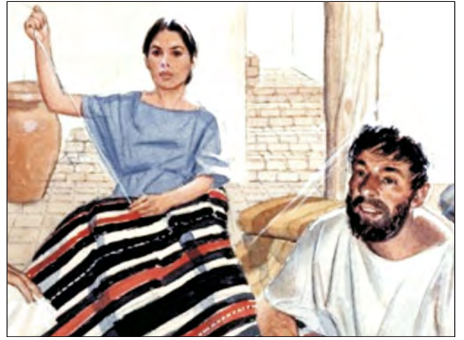
Priscilla and Aquila, Paul's Companions

தேசத்துக் குடிகள் எல்லாரும் சோர்ந்துபோனார்கள் என்றும் அறிவேன். நீங்கள் எகிப்திலிருந்து..... சிவந்த சமுத்திரத்தின் தண்ணீரை வற்றிப்போகப் பண்ணினதையும்..... சீகோனுக்கும் ஓசூக்கும் செய்ததையும்.....எங்கள் இருதயம் கரைந்து போயிற்று... உங்கள் தேவனாகிய காத்தரே உயரவானத்திலும் கீழே பூமியிலும் தேவனானவர். "(யோசுவா 2:9-11)