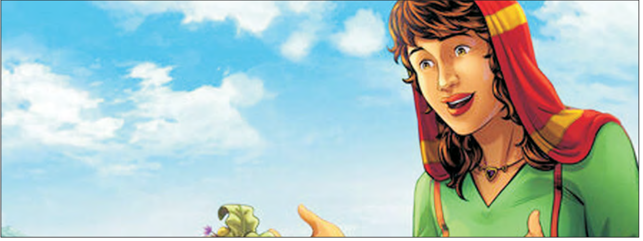
Leah, first wife of Jacob

கீழ் படிவதே நம் முடைய உண்மையான நோக்கத்தைக் கண்டுபிடித்து வாழ்வதற்கான ஒரே வழி என்று வேதத்தின் மூலம் அறிந்திருக்கிறோம். அர்ப்பணிப்பு நம்முடைய பரிசுத்தமாக்குதலில் ஒரு முக்கியமான படியாகும்.