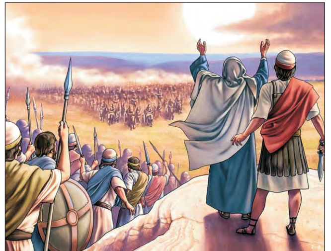
Deborah and Barak on behalf of Israel

தெபோரான் ஒரு பிரபலமற்ற எபிரெயின் மனைவி, ஆனால் அவள் இஸ்ரவேலின் நியாயாதிபதியாக இருந்தாள். நியாயாதிபதிகளின் 450 ஆண்டு காலத்தில், சோர்வும் மனமடிவும் ஏற்பட்ட