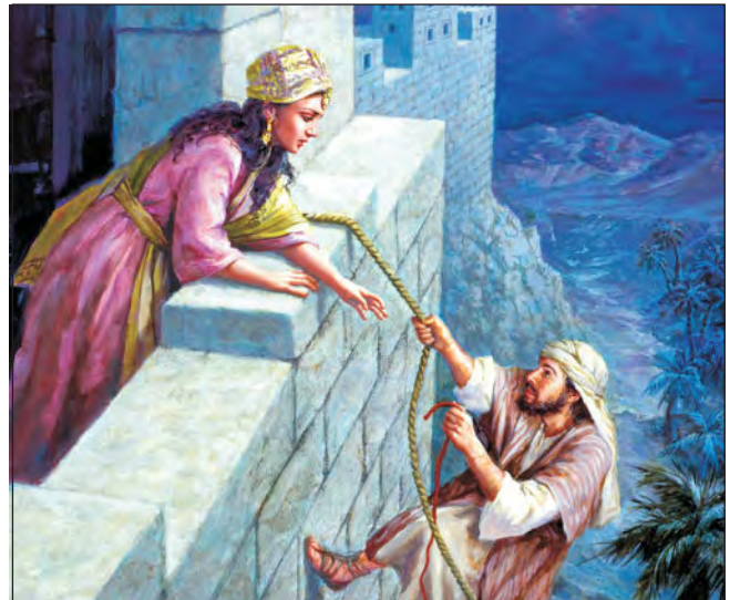
Rahab, helping the spies