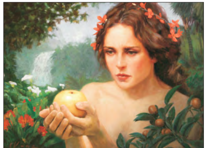
Mother Eve, with a choice

இந்த சட்டம் ஏவாளுக்கு எப்படித் தெரிவிக்கப்பட்டது என்ற நமக்கு சொல்லப்