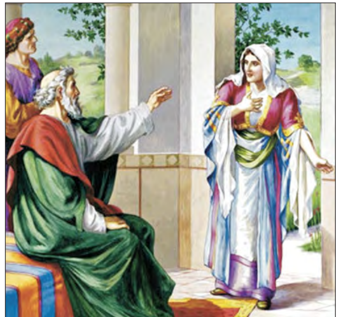
Elisha foretelling that the woman would have a son

இந்த இரக்கம் கொடுக்கக்கூடிய ஒரு பெணின் விசுவாசத்தின் மூலம் வந்தது. அவளுடைய