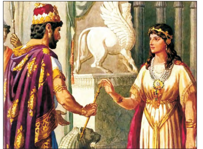
Queen Esther approaches the king

விரோதங்கள் இருந்தபோதிலும், நகோமியின் கணவர் எலிமெலேக்கு தனது குடும்பத்தை அழைத்துக்கொண்டு சவக்கடலுக்குக் கிழக்கே மோவாபின் வளமான மலைப்பகுதிகளில் குடியேறினார். யூதேயா மலைகளுக்கு கிழக்கே உள்ள ஒரு பீட பூமியில் நம்பகமான மழைப் பொழிவு விவசாயத்தை அனுமதித்தது என்று தொல்பொருள் ஆராய்ச்சியாளர்கள் கண்டுபிடித்துள்ளனர். வெளிப்படையான வறட்சியால் இந்த தேசம் பாதிக்கப்படவில்லை என்றும் மேலும் மோவாபின் கீழ் இருந்த காலத்தில் குடும்பம் பயணிக்க முடிந்தது. (நியாயாதிபதிகள் 3:12-30 ல்குறிப்பிட்டபடி பதினெட்டு வருடங்களாக இருக்கலாம்.) அந்தக் குடும்பம் அங்கிருந்த பத்தாண்டுகளில், மோவாபியப்