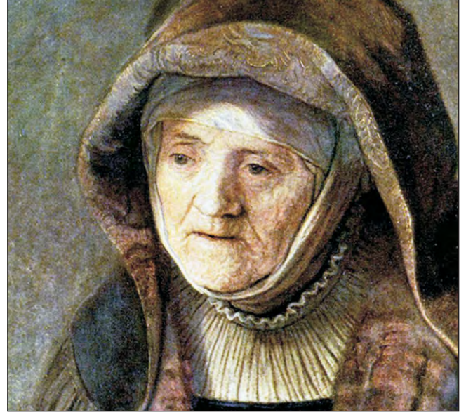
Anna the Prophetess

குறிப்பிடத்தக்க ஆதரவு, அவள் சார்பாக மாறியதை கண்டாள். மொர்தேகாய்க்கு கட்டிய தூக்கு மேடையிலேயே ஆமான் கொல்லப்பட்டபோது மொர்தேகாய் கௌரவிக் கப்பட்டார். இதன் விளைவாக, எஸ்தரின் ஜனங்கள் அழிவிலிருந்து காப்பாற்றப்பட்டனர்.