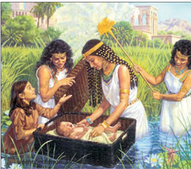
Jochebed's Son Moses, found and saved

விரும்புவோருக்கு பொறுமை மிகவும் பயனுள்ள கருவி என்று அண்ணாள் நமக்கு கற்பிக்கிறாள். (ரோமர் 8:19)