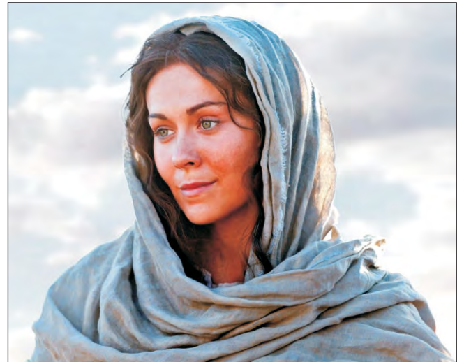
Mary, Mother of Jesus

இந்த இருவரும் தேவனுடைய பார்வையில் குணசாலிகளாக இருந்தபோதிலும், உலகம் அவர்களை வித்தியாசமாக பார்த்தது. அவர்களின் வாழ்க்கையைப் பற்றிய ஆய்வில் அவர்களின் வேற்றி தேவனுடைய அன்பான பிள்ளைகள் என்ற அடையாளத்துடன் பிணைக்கப்பட்டிருப்பதைக் காண்கிறோம்.