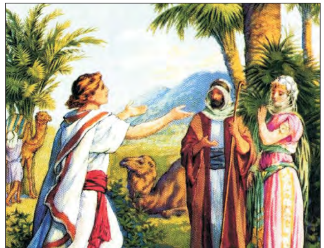
Rebekah introduced to Isaac

நேசிக்கிறேன் என்பதை நீர் அறிவீர் என்றான். அவர் - என் ஆடுகளை மேய்ப்பாயாக என்றார். (17) மூன்றாந்தரம் அவர் அவனை நோக்கி - யோனாவின் குமாரனாகிய சீமோனே, நீ என்னை நேசிக்கிறாயா என்றார். என்னை நேசிக்கிறாயா என்று அவர் மூன்றாந்தரம் தன்னைக் கேட்டபடியினாலே, பேதுரு துக்கப்பட்டு, ஆண்டவரே, நீர் எல்லாவற்றையும் அறிந்திருக்கிறீர். (2) நான் உம்மை நேசிக்கிறேன் என்பதையும் நீர் அறிவீர் என்றான். இயேசு - என் ஆடுகளை மேய்ப்பாயாக என்றார்." (யோவான் 21:15-17) முதல் இரண்டு முறை, இயேசு பேதுருவிடம் அகாபே அன்புடன் தன்னை நேசிக்கிறீரா என்று கேட்டார். இது அன்பின் உயர்ந்த வடிவம். தெய்வீக அன்பு, இருதயப்பூர்வமான அன்பு) ஆனால் பேதுரு ஃபிலியோ அன்புடன் இயேசுவை நேசிப்பதாக அவர் பதிலளித்தார். (இதுவும் ஒரு உயர் தரமான அன்பு - இரணம், கருணை) மூன்றாவது முறை, பேதுருவால்