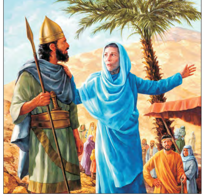
Deborah the prophetess

ஈசாக்கு முதற்பேறான ஆசீர்வாதத்தை ஏசாவுக்கு கொடுக்க திட்டமிட்டபோதிலும், அந்த ஆசீர்வாதத்தை பெற யாக்கோபே தகுதிப்பெற்றவர் என்பதை ரெபெக்காள் நினைவு கூர்ந்தாள்.