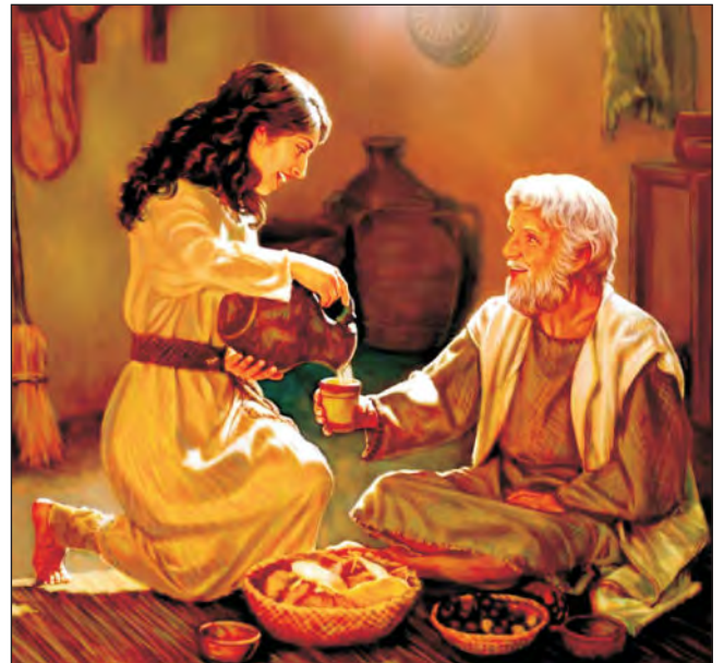
Esther and Mordecai

இராஜாவின் அழைப்பின்றி அவர் முன் நிற்பதற்கு எஸ்தர் முதலில் தன் உயிரைப் பணயம் வைத்தாள். அதிர்ஜடவசமாக, அவளுடைய தோற்றம் அவருக்கு மகிழ்ச்சியைத் தந்தது, மேலும் அவர் அவளிடம் என்ன வேண்டும் என்று கேட்டார். அவர் தனது இராஜ்யத்தின் பாதியை அவளுக்கு வழங்க தயாராக இருந்தார். உடனே அவள் தன் முழு வழக்கையும் இராஜாவுக்கு முன் எடுத்துரைத்